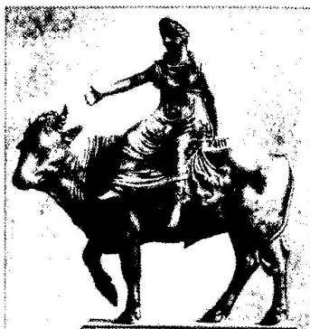
Bartolomeo Bellano, Europa na byku

Od tej pory żyli razem długo i szczęśliwie.